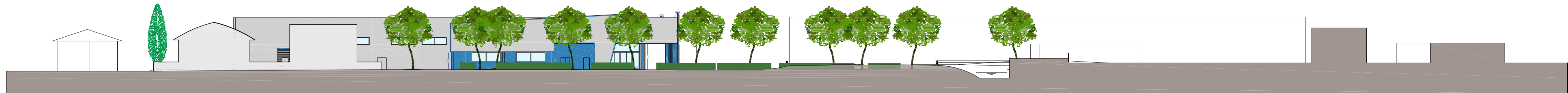
Sezione Ambientale 4-4