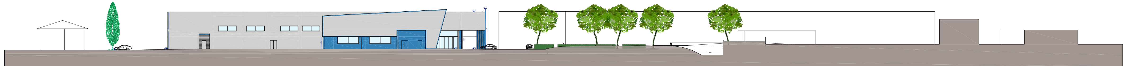
Sezione Ambientale 3-3