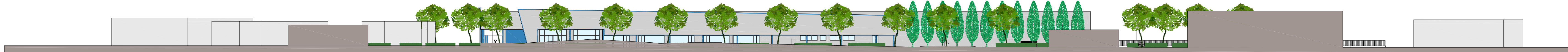
Sezione Ambientale 2-2